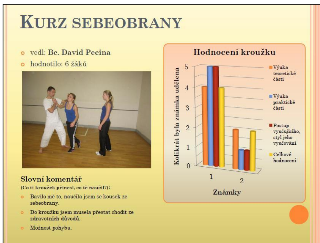
Obrázek č. 1: Hodnocení kroužku Kurz sebeobranu - fotka z kroužku, graf a slovní komentáře vyplývající z uvedeného dotazníku.

teoretické části, výuka praktické části, postup vyučujícího a jeho styl vyučování, a celkové hodnocení. Dotazovaní hodnotili známkami jako ve škole od 1 do 5. Mohli také přidat slovní komentář a tak přesněji specifikovat, v čem jim účast v kroužku prospěla, co jim přinesla a co se v kroužku naučili. Celkem měli možnost ohodnotit až čtyři kroužky. Většina z nich této možnosti využila a v dotazníku tak bylo ohodnoceno všech 21 kroužků SVČ. Nejčastěji byly hodnoceny tyto kroužky: Maturitní seminář z matematiky, Znakový jazyk a Literárně-filmový seminář. Z hodnocení vyplývá, že dotazovaní byli s vedením a vyučováním kroužků většinou spokojeni, líbil se jim také postup vedoucího, neboť u všech kroužků převažují mezi udělenými známkami jedničky, dvojky, jen občas trojky a výjimečně čtyřky. Samé jedničky dostaly od žáků kroužky Základy angličtiny a Italština, které vedla jedna vyučující a je tedy patrné, že její styl vyučování je pro žáky ideální a vyhovující. Zámka pět se objevila pouze u kroužků Kociánka, Španělština pro začátečníky a Příprava na testy TSP a SCIO, přičemž u posledního zřejmě došlo k omylu a žákyně si zaměnila hodnocení známkami s udělováním bodů, neboť její slovní komentář byl pochvalný. U španělštiny byl problém v nepravidelné účasti žáků a v dřívějším ukončení kroužku. V případě kroužku Kociánka byla jedna žákyně nespokojena s postupem vedoucí. Všichni vedoucí a vyučující byli s hodnocením svých kroužků seznámeni prostřednictvím přehledné prezentace.