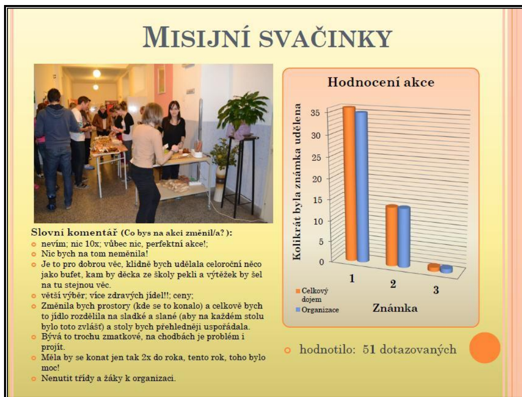
Obrázek č. 2: Hodnocení akce - misijní svačinky - fotka z akce, graf a slovní komentáře vyplývající z uvedeného dotazníku.