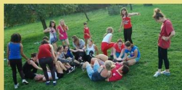
Obrázek č. 2: Hodnocení akce - adaptační kurzy - fotky z akce, graf a slovní komentáře vyplývající z uvedeného dotazníku.