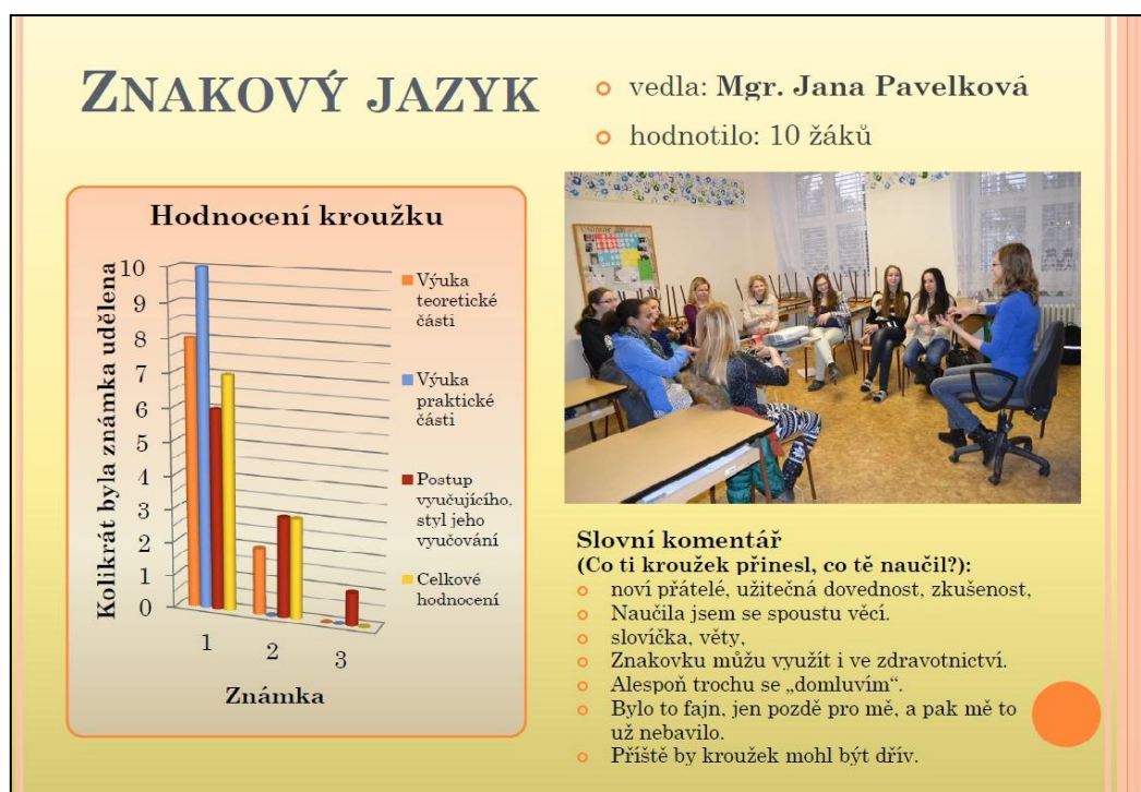
Obrázek č. 1: Hodnocení kroužku Znakový jazyk (z uvedené prezentace) - fotka z kroužku, graf a slovní komentáře vyplývající z uvedeného dotazníku.

Další dvě otázky, čtvrtá a pátá, byly zaměřeny na akce, které uspořádalo nebo se na jejich organizaci nějakým způsobem podílelo SVČ. Jako nápověda byly v dotazníku uvedeny tyto akce: adaptační kurzy, Oslava svátku sv. Anežky České, Benefice sv. Anežky, Vánoční besídka, misijní svačinky, Reprezentační ples CSZŠ, přehlídka v Odrách a Kurz pro animátory. Dotazovaní kromě těchto akcí uvedli a ohodnotili ještě Duchovní den, akci Svitavský fanda, den otevřených dveří, návštěvu v centru pro neslyšící, kino, přípravu dne seniorů, exkurzi do